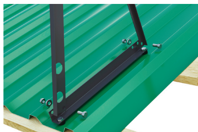
Рис.2 На основание закрепить стойку ограждения и подкос, используя болт М8х20. Соединить их между собой таким образом, чтобы стойка была перпендикулярна плоскости земли.