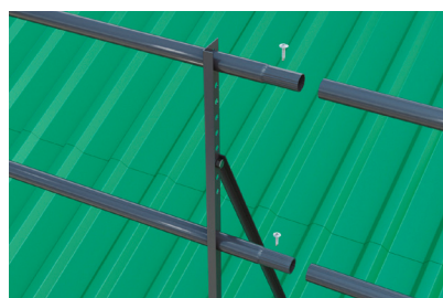
Рис.5 Горизонтальные трубы обжаты с одной стороны, для соединения в одну линию. Фиксацию соединения произвести с помощью саморезов.