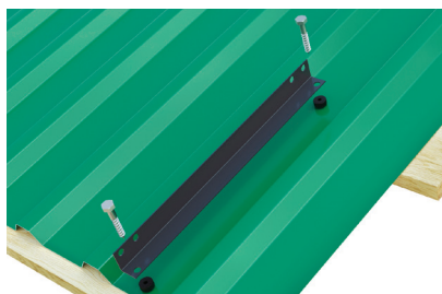
Рис.1 Установить основание на кровельное покрытие с помощью шурупов 8x50. Закрепить через кровельное покрытие к доскам обрешетки. Пластикат h-7мм использовать между кровельным покрытием и основанием. Повернуть присоской вниз.