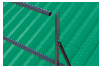
Рис.3 В отверстия диаметром 27 мм, установить горизонтальные трубы, служащие поручнями.