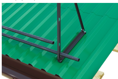
Рис.4 Стандартная форма стойки позволяет установить 2 дополнительные трубы, выполняющие функцию снегозадержания.