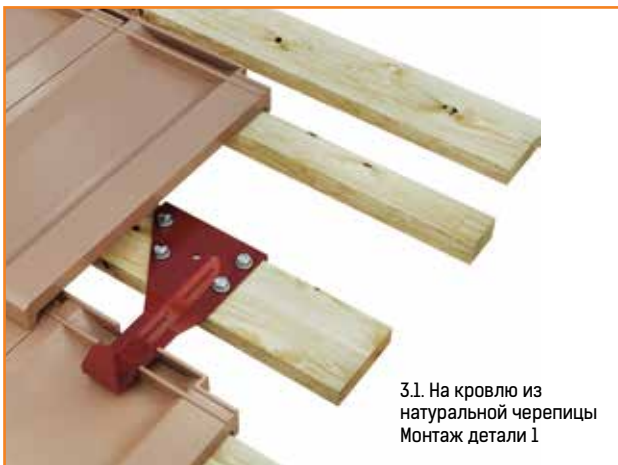
3.1. На кровлю из натуральной черепицы Монтаж детали 1