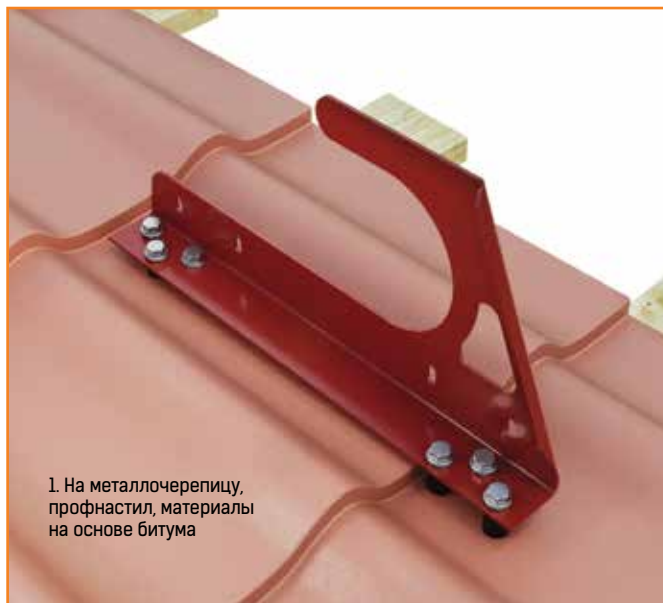
1. На металлочерепицу, профнастил, материалы на основе битума