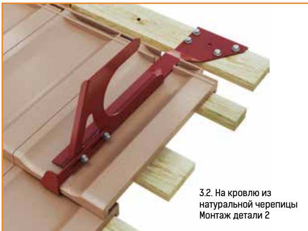
3.2. На кровлю из натуральной черепицы Монтаж детали 2