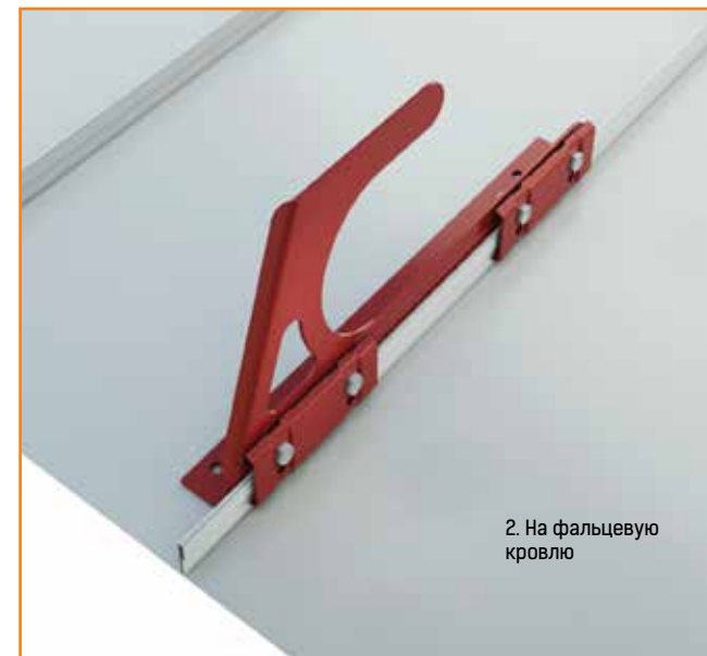
2. На фальцевую кровлю