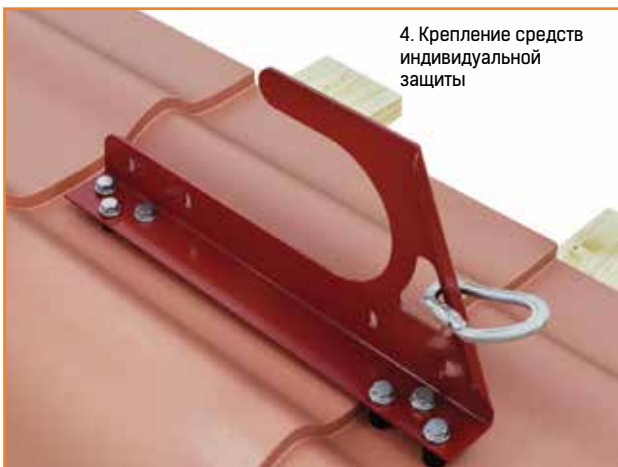
4. Крепление средств индивидуальной защиты

С другими видами продукции BORGE, такими как: